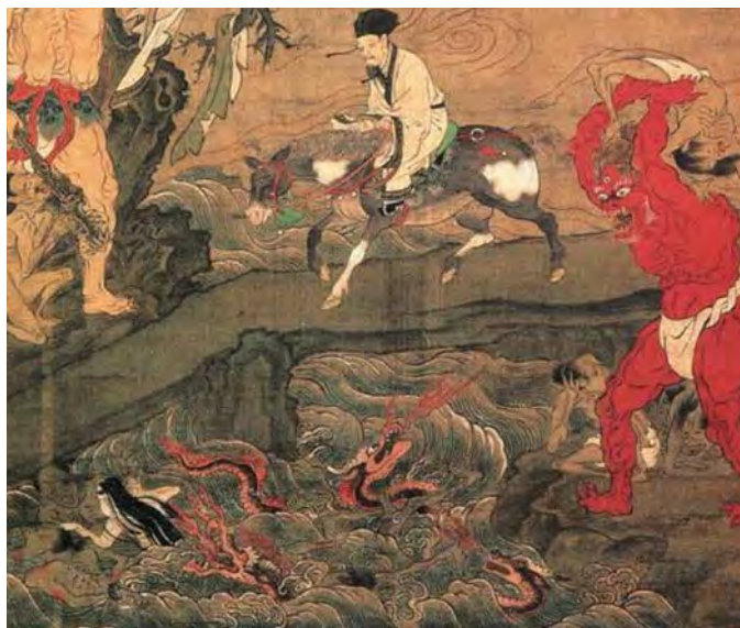
Тосой Міцунобо. Річка Сандзу, 1450 р.

Сандзунокава. Про зв'язок між різними світами свідчить ще один символічний образ твору — річка Сандзу (в українському перекладі Сандзунокава). Це не саме пекло, а річка, що відділяє світ живих від потойбічного світу. Подібний образ можна знайти в інших народів, наприклад, у давньогрецькій міфології: Стікс, Ахерон. У японській мові смерть часто евфемістично виражається як перехід через річку Сандзу.