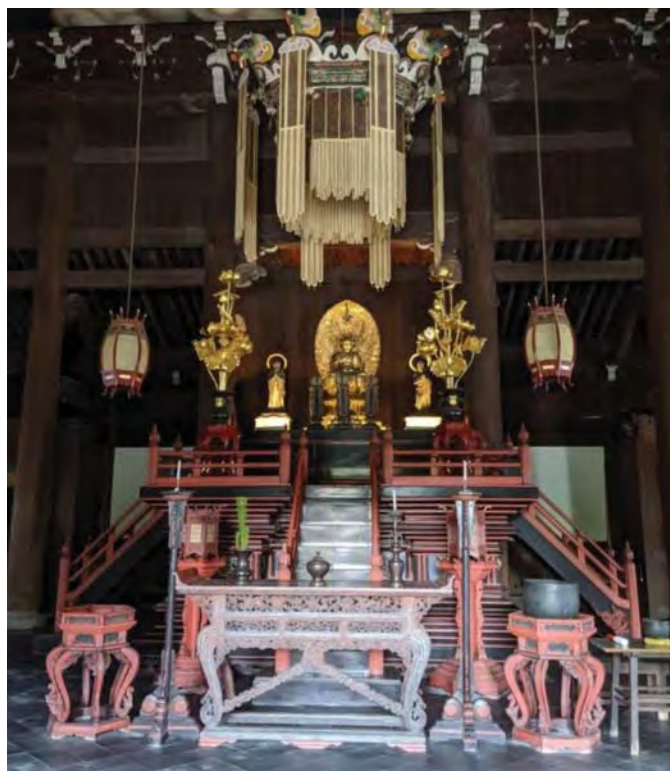
Статуя Будди в храмі Кенніндзі. XIII ст. Кіото (Японія)

Як ми зазначили, існує тенденція до переосмислення образу Кандати як символу людського існування взагалі. Однак ця точка зору викликає чимало роздумів і заперечень. Та все ж таки ми не схильні розглядати образ Кандати як втілення людства (людського існування) загалом, адже Кандата зображений у творі як чоловік, який убивав людей і підпалював їхні будинки. Кандата був убивцею і підпалювачем, людиною, котра вчинила не одне, а багато злих діянь. А такі