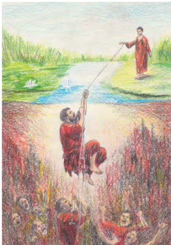
Сергій Ярошенко. Ілюстрація до новели «Павутинка». 2026 р.