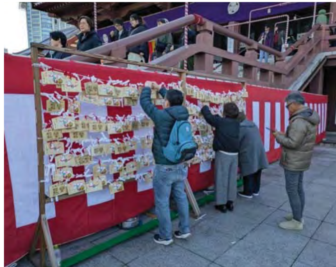
Молоді й дорослі люди пишуть записки Будді про свої мрії та бажання. Буддистський храм Зодзоджі. Токіо (Японія)

спочатку можуть здатися заплутаними, можна розглядати як навмисні запитання, поставлені автором, щоб спонукати читачів до глибших роздумів. Завдяки своїй семантичній відкритості «Павутинка» продовжує кидати виклик читачам, запрошуючи до роздумів про відповідальність, співчуття та крихкі зв'язки, що поєднують людей через межі гріха і спокути. Ми сподіваємося, що ця стаття стане певним стимулом як для учнів, які вивчають новелу Акутагани як художній текст, так і для вчителів, які використовують її на уроках і мають знайти власні підходи для інтерпретації твору. Бажаємо всім, хто навчає і хто навчається, власних відкриттів у діалозі з Акутагавою!