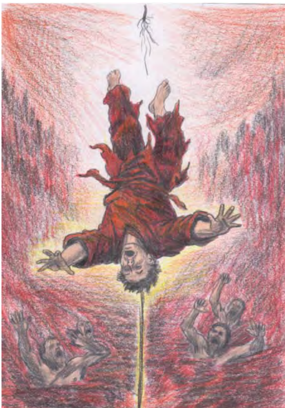
Сергій Ярошенко. Ілюстрація до новели «Павутинка». 2026 р.