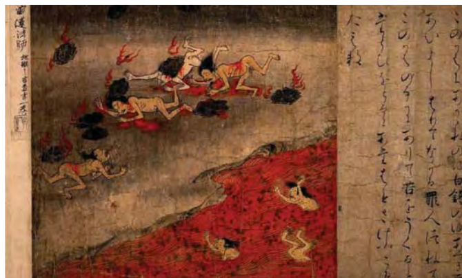
Японське пекло (Джігоку). Ілюстрація з книги «Джігоку дзьосі». XII ст. Токійський національний музей (Японія)

люди все ж таки не є типовими для суспільства. Тому, на наш погляд, було б краще розглядати Кандату не як утілення людського існування загалом, а як утілення грішника (чи гріха, чи гріховності людської природи), котрий опинився в пеклі через свої дуже погані вчинки. У тексті йдеться й про інших грішників, серед яких опинився Кандата. Цікаво, що він перебував на самому дні пекла, борсався і захлинявся в Кривавому озері (в оригіналі Ставок крові). Тобто гріх Кандати був одним із найважчих серед інших грішників.