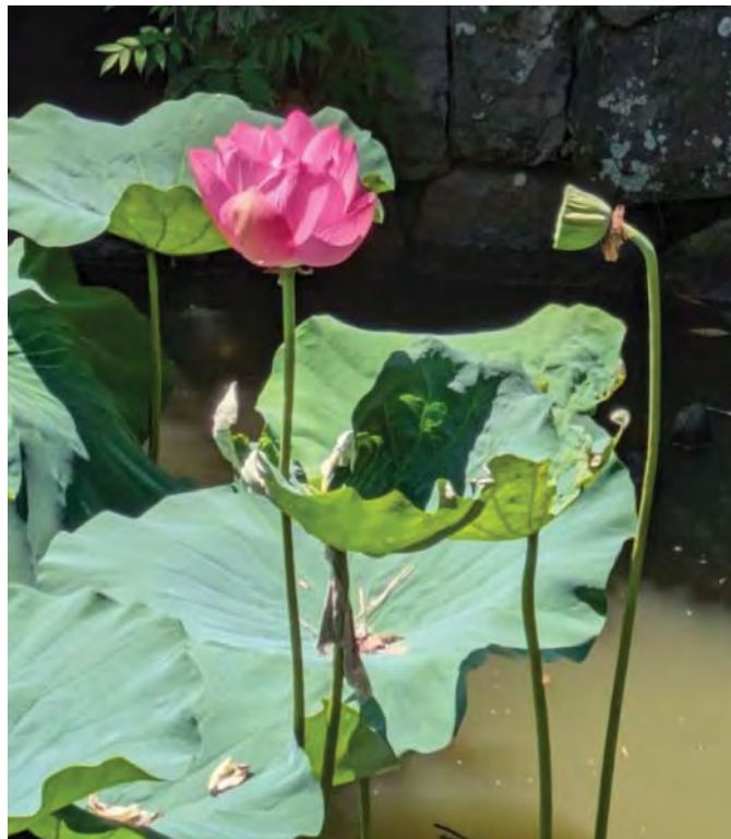
Лотос у храмі Камакура (Японія)

В останній частині оповідач використав мотив байдужості лотоса до долі Кандати, як й інших грішників. Квіти лотоса, згідно з оригінальним текстом, байдужі до того, що зробив Кандата. Це ніби говорить про те, що людина благородного духу часом може бути також холоднокровою істотою. Але той факт, що квіти лотоса залишилися такими ж прекрасними та чистими, свідчить про вічність духовних цінностей, на які не впливають дії окремих грішників.