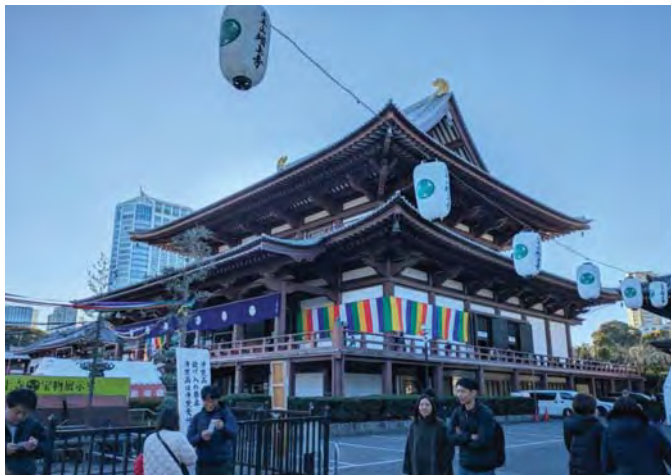
Буддйський храм Зодзоджі. Кін. XIV ст. Токіо (Японія)

ти в різних напрямках і площинах. Тому оповідання є прикладом філософської новели, що передбачає множинність сенсів та інтерпретацій.