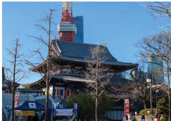
Буддійський храм Зодзоджі. Кін. XIV ст. Токіо (Японія)

На початку твору оповідач вказує зовнішні гріхи Кандати — убивства, підпал будинків людей. Тому герой опинився в Кривавому озері і терпить страшні муки серед інших грішників. Але в процесі розвитку сюжету Кандата чинить внутрішній гріх: він виявляє егоїзм і звертається до інших грішників, які причепилися до павутинки, щоб вони повернулися до пекла. У другому випадку Кандата нікого не вбив, він має лише намір, щоб інші грішники спустилися назад. Усі вони чіплялися за одну нитку, яка могла обірватися будь-якої миті, тому можна стверджувати, що важко зрозуміти, чому Кандату називають безжальним [5, с.177.] Ми вважаємо, що це питання також залишається відкритим для читачів.