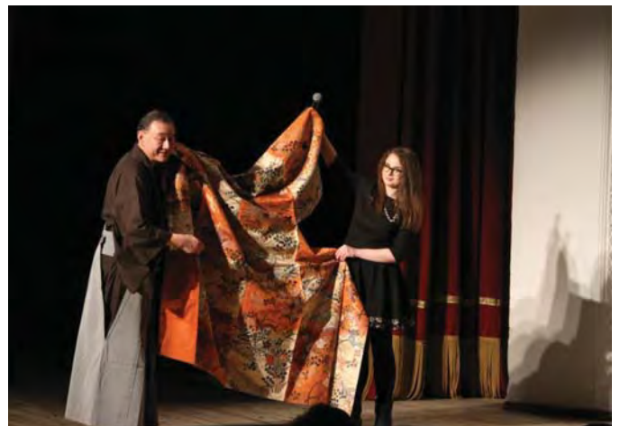
Японський актор Харухіса Кавамура проводить майстер-клас для студентів і акторів на сцені Полтавського академічного музично-драматичного театру імені М.В. Гоголя. 2018 р.