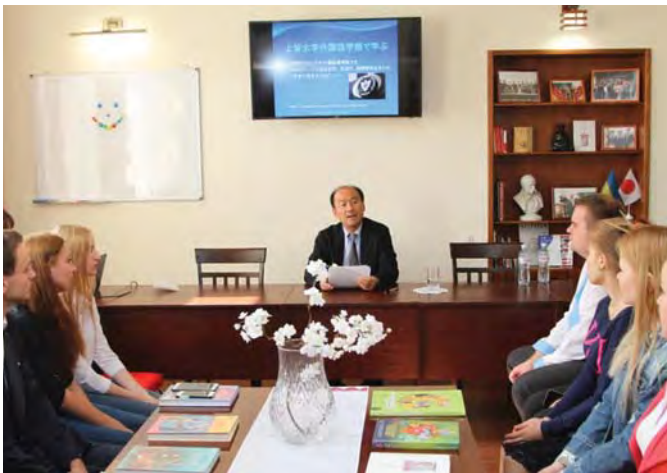
Професор Shin'ichi Murata читає лекцію про театр для студентів ПНПУ імені В. Г. Короленка. Центр українсько-японської дружби «Sakuga» ПНПУ імені В. Г. Короленка. 2017 р.

Ви підтримуєте тісний зв'язок з театральними колами Японії та світу. Як, на Вашу думку, розвивається театр в різних країнах? Які тенденції вважаєте перспективними?