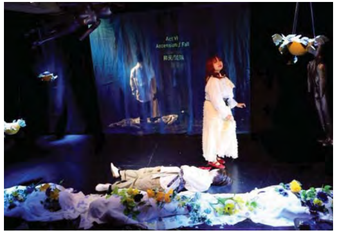
Сцена з вистави «Ліліт» за п'єсою Михайля Семенка, поставленою трупю «Міське сузір'я» (Маті-но сейдза) в Токіо. Прем'єра відбулась 22 січня 2026 р.

Сподіваюсь, що всі ці плани поєднають театр із теорією і методикою, наукою і практикою, освітою і творчістю.