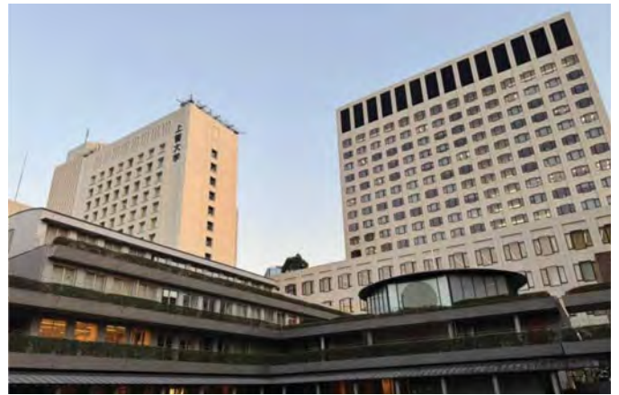
Sophia University (Токіо). 2025 р.

Гоголя «Одруження». Потім були інші п'єси. Пізніше, коли я вже працював в Sophia University в Токіо, ми зі студентами щороку готували нову виставу.