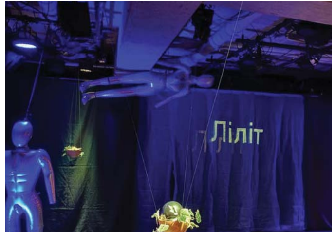
Сцена з вистави «Ліліт» за п'єсою Михайля Семенка, поставленою трупою «Міське сузір'я» (Маті-но сейдза) в Токіо. Прем'єра відбулась 22 січня 2026 р.

Прем'єру із задоволенням подивились не лише японці, а й українці-японісти, які живуть у Японії, що мене дуже потішило.