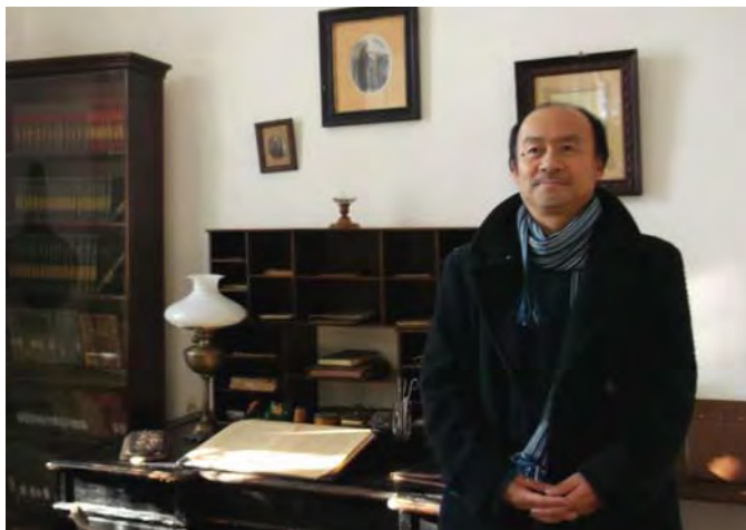
Професор Shin'ichi Murata знайомиться з експозицією Полтавського літературно-меморіального музею В. Г. Короленка. 2014 р.