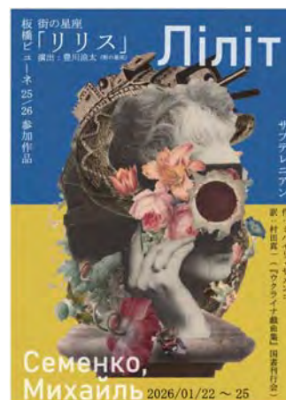
Афіша вистави «Ліліт» за п'єсою Михайля Семенка, поставлена трупю «Миське сузір'я» (Маті-но сейдза) в Токіо. Прем'єра відбулась 22 січня 2026 р.