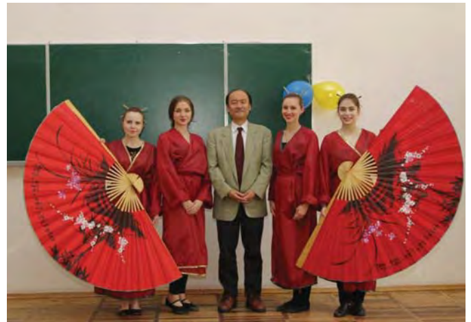
Професор Shin'ichi Murata серед студентів ПНПУ імені В. Г. Короленка. Полтава. 2016 р.

Окрім того, сучасний світ змушує нас бачити все чітко, але поверхово. Однак це справжній обман, тому що, як правило, не буває чіткості й однозначності у справжньому житті, тут усе абстрактно, онірично і не дуже зрозуміло. Людина повинна думати, відчувати зв'язок себе самої із зовнішнім світом інтелектуально й духовно. Щодо цього театр ніколи не застаріє.