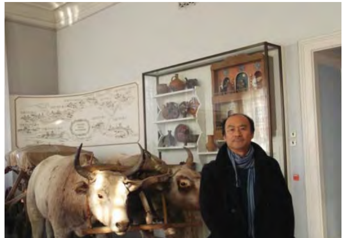
Професор Shin'ichi Murata знайомиться з експозицією Полтавського краєзнавчого музею. 2014 р.

Мене зацікавила передовсім специфіка української драматургії, що поєднує в собі древні традиції слов'янства і європеїзм. Це обумовлено не лише суспільно-політичним розташуванням країни, але й унікальною ментальністю українського народу. На тлі літератури й мистецтва яскраво виявляються багатомовність, культурне різноманіття, що в наш час вважають однією з демократичних цінностей у багатьох цивілізованих народів.