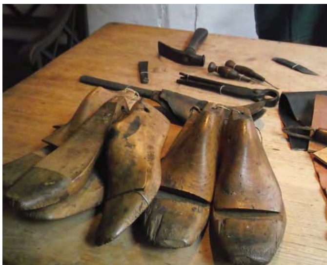
Приладдя чоботаря. Музей Г. К. Андерсена. м. Оденсе (Данія)

Оскільки мати Ганса Крістіана прала білизну в холодній воді, єдиною втіхою бідної жінки був шнапс, що приводило сина у відчай. Але у нього завжди були цікаві іграшки, які змайстрував йому батько. У вільний час батько читав синові народні казки і твори різних письменників. В автобіографії «Правдива історія мого життя» (1846) Андерсен писав: «Мій батько виконував усі мої бажання. Я повністю займав його думки і серце, він жив мною. У вихідні він робив для мене збільшоване скло, влаштовував театр, робив малюнки, які можна було змінювати, а з них складала історії». Та батько, котрий отримав поранення на війні, жив недовго... 1816 року трапилося лихо — батько Андерсена помер, і юному Гансові довелося припинити навчання і шукати роботу. Він працював помічником у ткача, потім у шевця, згодом потрапив на тютюнову фабрику. Смерть батька стала тяжкою втратою для Андерсена, котрий мусив сам прокласти собі дорогу в житті.