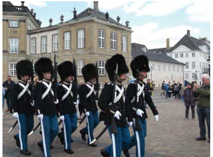
Королівська варта Данії. м. Копенгаген (Данія)

Андерсен народився 2 квітня 1805 року в маленькому містечку Оденсе на острові Фюн (територія Данії охоплює кілька островів) у родині бідного чоботаря і пралі. Вважається, що Ганс Крістіан народився у маленькому одноповерховому будиночку, пофарбованому в жовтий колір. За часів Андерсена будинок цей був розташований у найбіднішій частині міста Оденсе, мешканці якого належали до найнижчих шарів суспільства. Тут жили солдати, жебраки, найманці, котрі бралися за будь-яку роботу. У домі, де народився великий казкар, жило п'ятеро сімей. Згодом родина Андерсена переїхала на іншу вулицю, в будинок, де митець мешкав із 2-х до 14-ти років. Наразі місця, де жив письменник, перетворені на музейні приміщення.