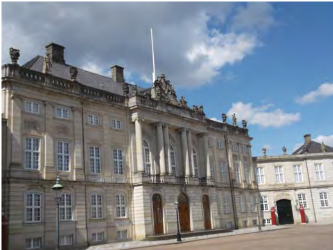
Королівський палац. м. Копенгаген (Данія)