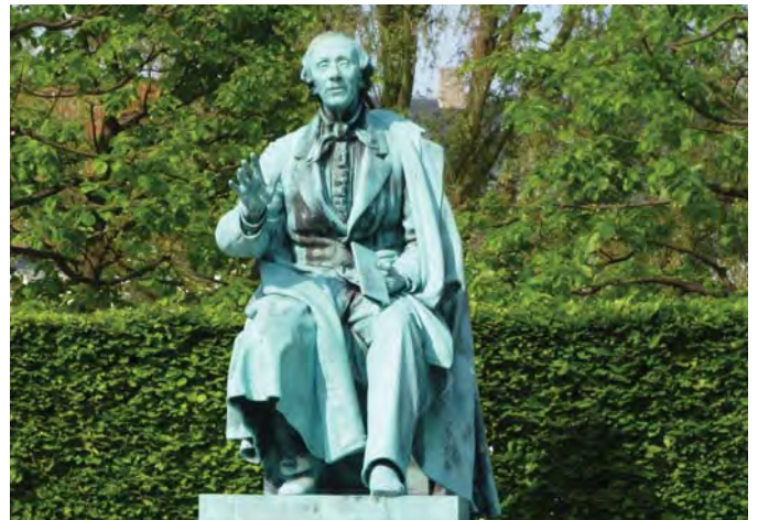
Пам'ятник Г. К. Андерсену в Королівському саду. м. Копенгаген (Данія)