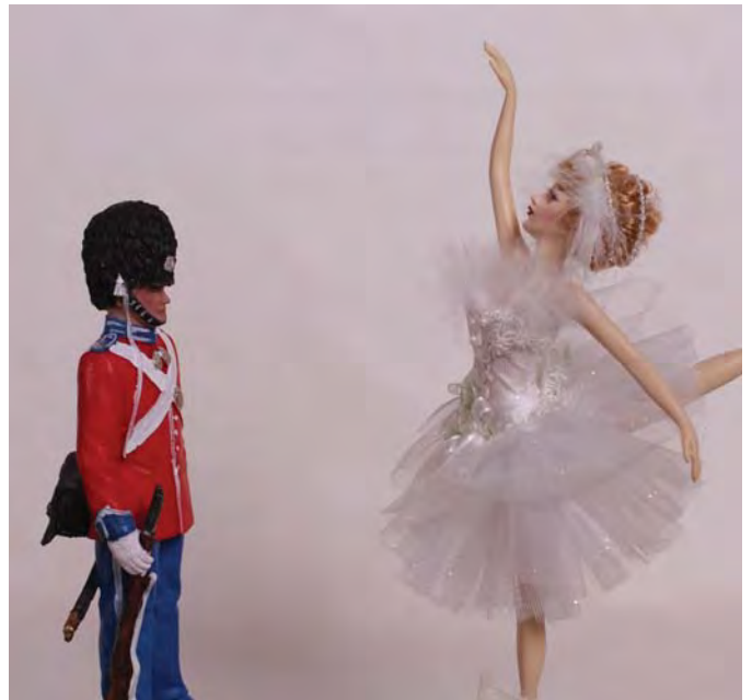
Олов'яний солдатик і балерина — іграшки дітей Данії