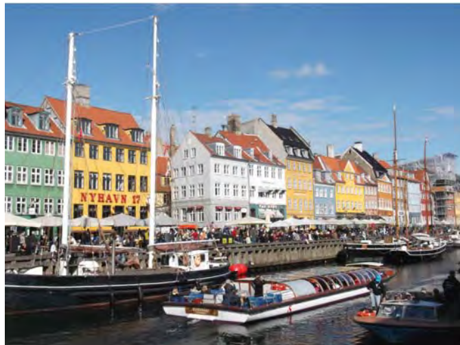
Нова Гавань (Ньюхавн). м. Копенгаген (Данія)