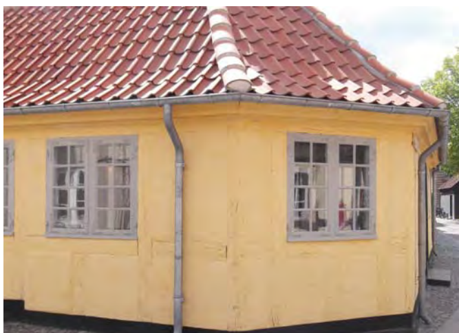
Будинок, де народився Г.К. Андерсен. м. Оденсе (Данія)

Улюбленою грою Андерсена був ляльковий театр. Він ріс великим мрійником і фантазером. Інтерес до іграшок і вигадування історій, пов'язаних із ними, письменник зберігав протягом усього життя. Ще дитиною хлопець обожнював театр. Він допомагав розклеювати афіші в рідному містечку, за це отримував (як платню) декілька афіш. У місцевому театрі щомісяця відбувалися вистави, і хлопчик дуже хотів стати актором. Він навіть дебютував у театрі м. Оденсе як статист.