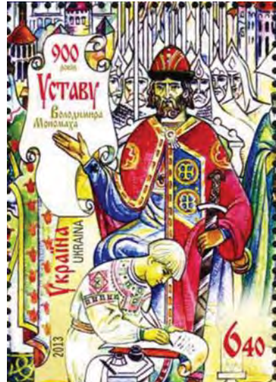
Поштова марка України «900 років Уставу Володимира Мономаха», 2013 рік