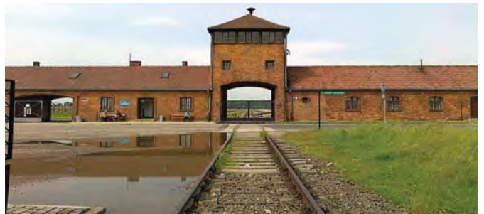
Головні ворота табору Аушвіц