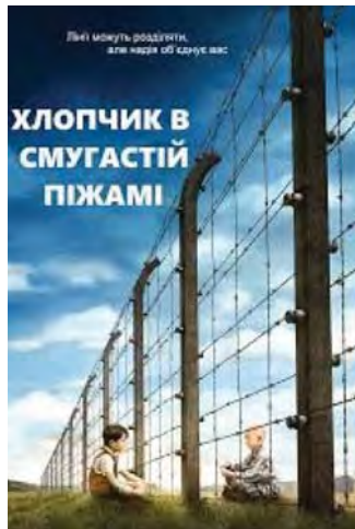
Афіші фільму «Хлопчик у смугастій піжамі» (режисер Марк Герман, 2008 р.)

Поміркуйте, чому нації, винні в масових трагедіях, мають пройти період каяття, як к це було в німців щодо євреїв?