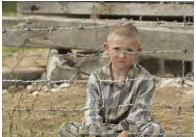
Кадр із фільму «Хлопчик у смугастій піжамі» (режисер Марк Герман, 2008 р.)